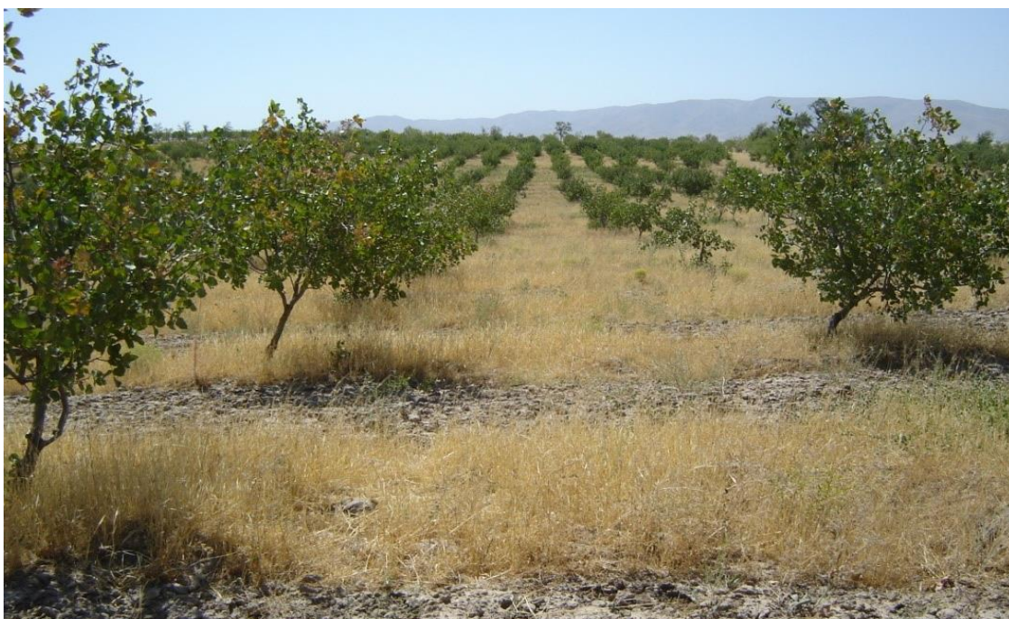
6-расм. Лалмикор ерларда барпо қилинган хандон писта плантациясининг умумий кўриниши.