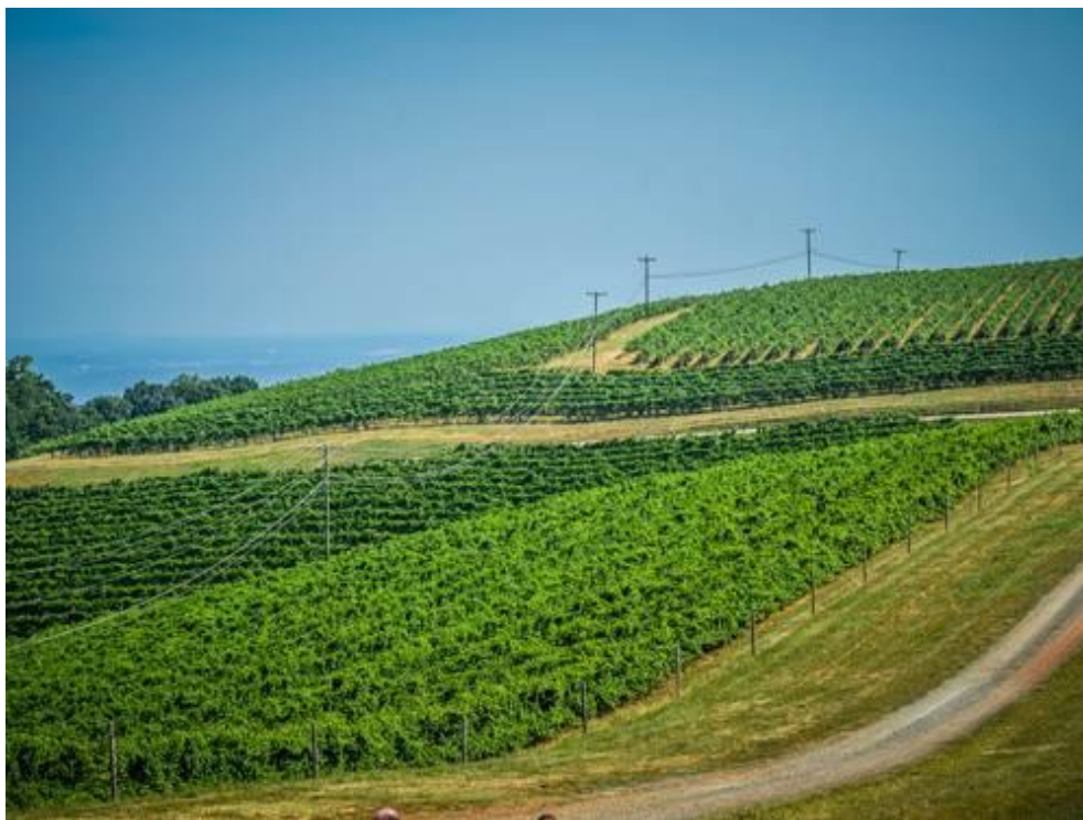
2-расм. Адир ерлардан унумли фойдаланиш учун узумзорлар барпо қилиш.

Илгари ҳайдалма ер сифатида фойдаланиб, бир йилдан ортиқ куз фаслидан бошлаб қишлоқ хўжалик экинларини экиш учун фойдаланилмаётган, шунингдек, шудгор қилиб қўйиш учун ажратилмаган ер тури бўз ерлардир. Бундай ерлар мамлакат умумий ер майдонининг 0,2 фоизини ташкил этади.