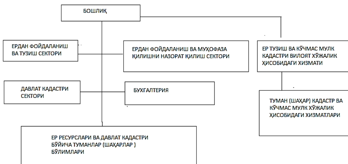
3-расм. Қорақалпоғистон Республикаси, вилоятлар ва Тошкент шаҳар ер ресурслари ва давлат кадастрлари бошқармаларининг таркиби.

Ўзимизнинг ҳамда чет эл мутахассислар ва олимларнинг фикрларига қараганда, ерлардан фойдаланишнинг самарадорлик даражасини пасайишига ҳамда уларни деградацияга учрашига асосий сабаб—мелиоратив ишларни етарли даражада молияланмаганлиги ҳамда Республикада ер ресурсларидан фойдаланишни паст самарали бошқаришдан.