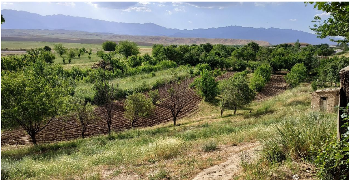
5-расм. Тоғ адирларда барпо қилинган мевали бог.

Олманинг Ёзги Хазарасп, Қишки Хазарасп, Шойи олма, Қизил олма, Голдин Дилишес, Ринел симиренко, Ўрикнинг шафтолисимон Жанбил, Жавзаки-1, Кечки Жавзаки, Қизил қандак, Ирис, Оқ пишар навларининг таъм ва товар сифатлари юқори бўлиб, ҳосилдорлиги ҳам бошқалардан юқори туради.