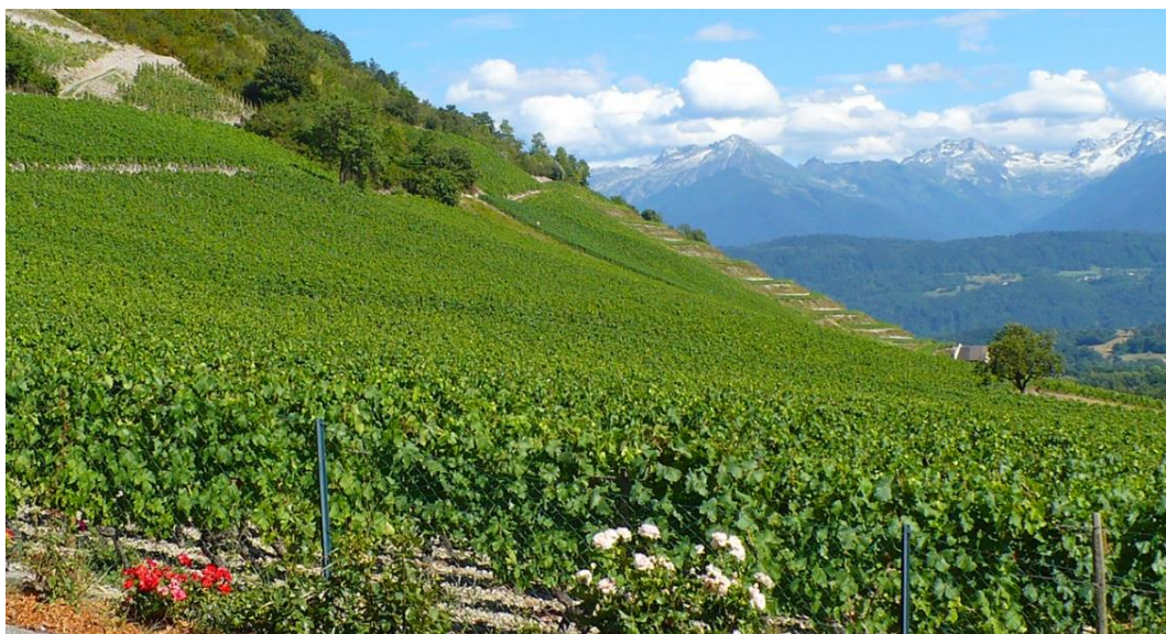
1-расм. Эрозияга учраган адир ерларда узумзорларни барпо қилиш

Ҳайдаладиган ерлар, пичанзорлар, яйловлар, бўз ерлар, кўп йиллик дарахтзорлар (боғлар, узумзорлар, тутзорлар ва ҳоказо.) эгаллаган ерлар қишлоқ хўжалиги ерлари жумласига киради (1-расм, 2-расм).