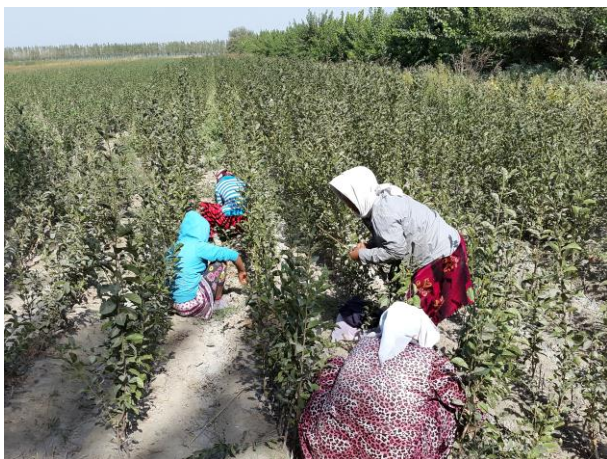
Расм 4. Кўчатзорнинг биринчи даласидаги пайвандлаш жараёни.

Кўчатзорнинг иккинчи даласи. Келаси йили эрта баҳорда шира ҳаракати бошлангунча пайванд қилинган жой очилади, бойлагич материаллари олиб ташланади ва пайванд қилинган куртакка кесилади.