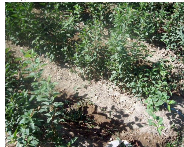
Расм 2. Кўчатзорнинг биринчи даласида пайвандланган ниҳоллар.

Кўчатзорнинг биринчи даласи. Илмий-тадқиқот муассасалари ва малакали фермер хўжаликлари тажрибасидан маълумки, олма уруғларини Ўзбекистонда бевосита кўчатзорнинг биринчи даласига экиш мумкин, бунда албатта пайвандлаш муддатигача кучли озиклантириш ҳисобига ниҳолларни етказиб олиш талаб этилади.