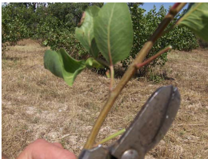
Рис.4. Удаление листовой пластинки

Окулировку производят в более прохладное время, то есть в утренние и вечерние часы звеном из двух человек. Один (прививальщик) выполняет непосредственно окулировку, другой производит обвязку места окулировки.