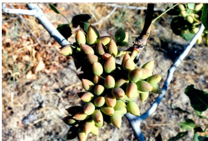
Рис.3. Плодовая кисть фисташки настоящей