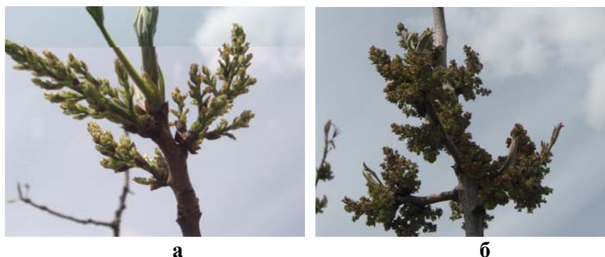
Рис.2. Женские (а) и мужские (б) цветки фисташки настоящей

Женские цветки фисташки рыхлые, продолговато - метельчатые соцветия длиной 2-7 см и шириной 1-2 см, впоследствии образуют плодовую кисть. Мужские цветки, компактные, густые, овально-округлые, до 2-5 см длины и 2-3 см ширины (рис.2). Пыльца отличается хорошо выраженной летучестью и высокой степенью произрастания. По литературным данным (Озолин, 1969), удовлетворительно опыляются женские особи фисташки, удаленные от основных насаждений на расстояние до 500 м.