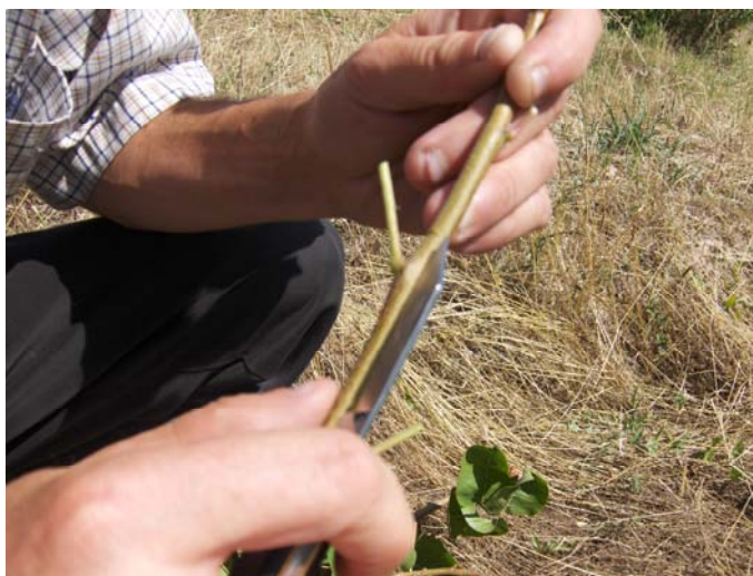
Рис.6. Вырезка щитка с почкой

Затем на привойном черенке вырезается щиток с почкой. Для этого на черенке выше выбранной почки на 8-10 мм делается поперечный надрез на диаметр черенка. С обеих сторон от глазка (почки), отступая от него на 4-5 мм, делаются два продольных надреза. С таким расчетом, чтобы они пересекались друг с другом на 20-25 мм ниже глазка. Получается щиток длиной 30-35 мм и шириной 8-12 мм. Последняя определяется толщиной стволика подвоя ( рис. 6 ).