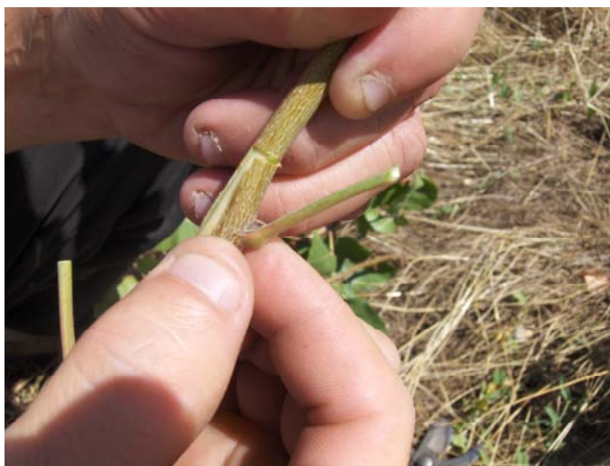
Рис.7. Отделение щитка с почкой

Снятый щиток с глазком быстро вставляется в Т - образный вырез на коре подвоя. Щиток с глазком устанавливают в вырез подвоя с таким расчетом, чтобы между его продольным краем и краем в вырезе подвоя остался просвет (зазор) шириной около 1 мм (рис.8,9.). Это необходимо для плотного прилегания вставленного щитка к древесине подвоя, а следовательно, успешного его приживания.