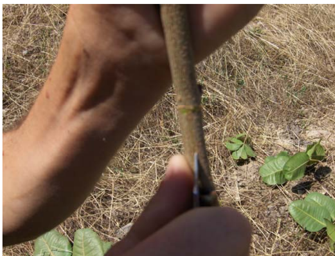
Рис. 5. Проведение Т - образного разреза на коре подвоя

Техника окулировки заключается в следующем: на коре подвоя простым окулировочным ножом делается Т - образный разрез (рис.5).