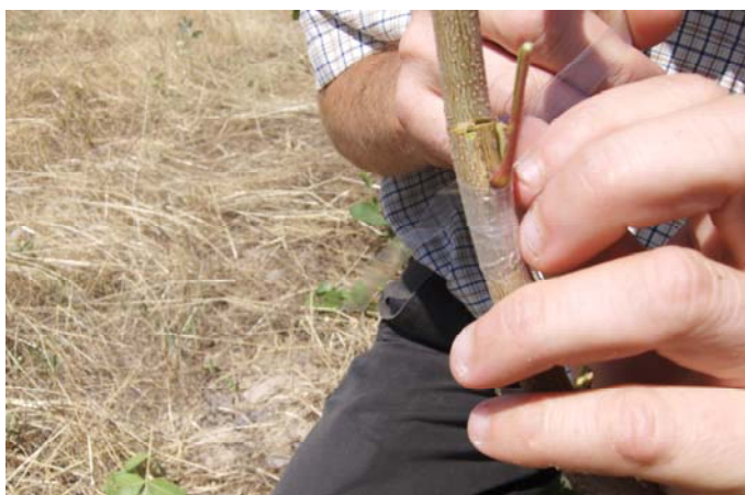
Рис. 10. Обвязка пленкой

Полное срастание щитка с подвоем обычно заканчивается через 15-20 дней. В это время производится снятие обвязок и ревизия прижившихся глазков. Прижившийся при окулировке щиток и глазок имеют свежий и здоровый вид. Если же щиток и глазок почернели и высохли, это значит, что окулировка не удалась и её следует повторить, если позволяют сроки.