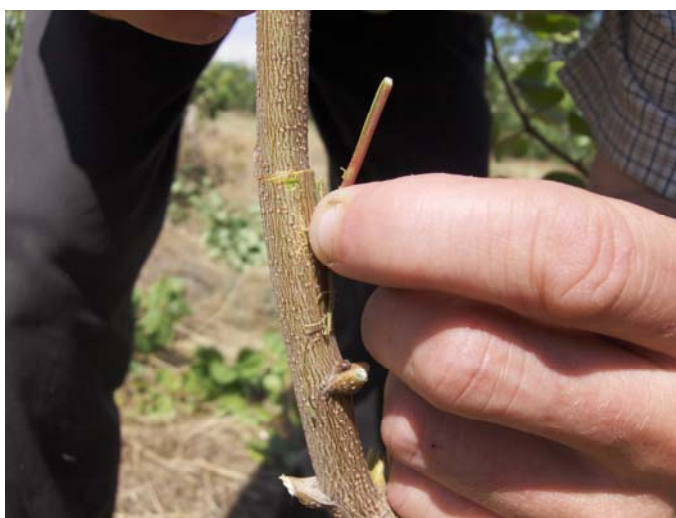
Рис. 8. Вставка щитка с почкой

При этом все разрезы должны быть закрыты пленкой, а глазок оставаться открытым (рис.10.). Длина полихлорвиниловой ленты должна быть 30-35 см, ширина 1-1,5 см.