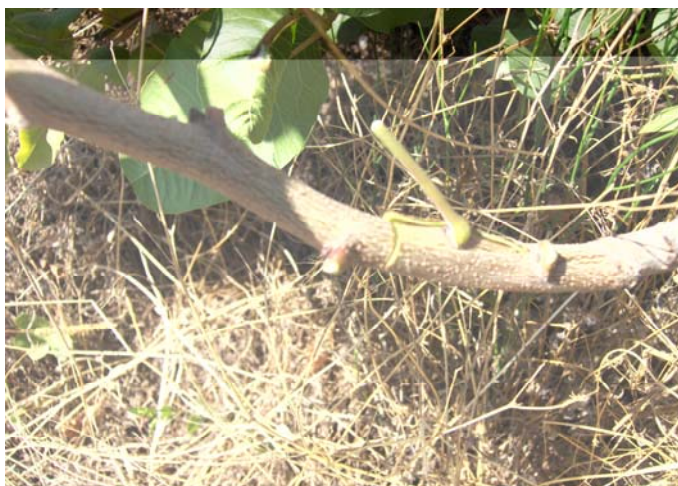
Рис.9. Вставленный щиток с почкой